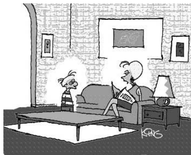
Figura 1. Um exemplo de figura

Figuras, quadros, gráficos e tabelas, incluindo seus títulos, devem ser inseridos no texto. As figuras também devem ser submetidas em resolução igual ou superior a 150px. Os títulos desses recursos devem ter fonte tamanho 10, em negrito, e devem ser centralizados se tiverem menos de uma linha (ver figura 1). No caso de mais de uma linha, devem ser justificados (ver figura 2).